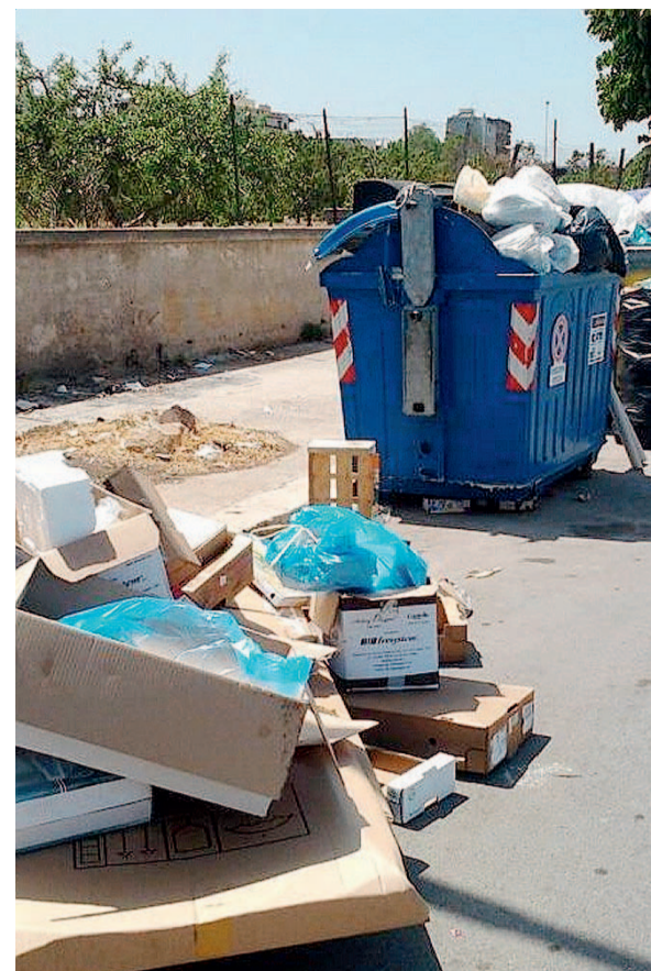
Rifiuti, il caso tiene banco a Bisceglie

Cittadini e forze politiche hanno manifestato i propri disappunti